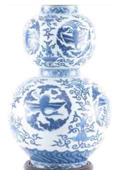
Vase double gourde en porcelaine de Chine, marque Wanli. Hauteur 30 cm.

Parmi les autres coups de cœur du commissaire-priseur, l'art asiatique tient une place importante, comme ce vase monté en lampe d'époque Ming, «un objet rare et qui compte dans l'histoire de l'art chinoise», précise le spécialiste qui est tombé dessus au hasard d'une visite chez un client et qui est estimée entre 2000 et 3000 fr.