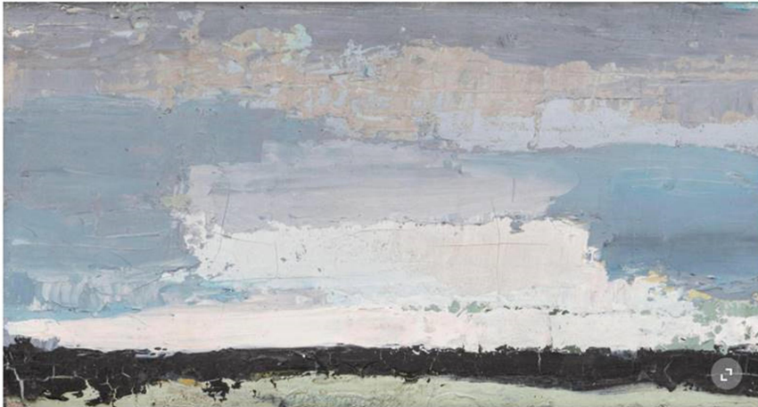
«Villerville-sur-mer» de Nicolas de Staël. Huile sur toile, signée au dos, datée 1952. 12 x 22 cm DR

Tous les lots seront exposés du jeudi 17 au dimanche 20 juin à l'espace Montelly.