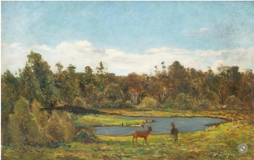
«Paysage aux chevreuils», de Paul Gauguin. Huile sur bois, 35,5 x 55,2 cm. Daté de 1876. DR

La maison Dogny Auction renoue avec la vente à la criée le 22 juin. Parmi les 400 lots, des grands crus, mais aussi des tableaux d'artistes renommés.